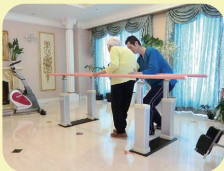
PTによる個別リハビリ

安心して生活して頂けるように、 介護体制は2対1と手厚くし、理 学療法士による個別リハビリや 認知症ケアのユマニチュードを 実践しています。