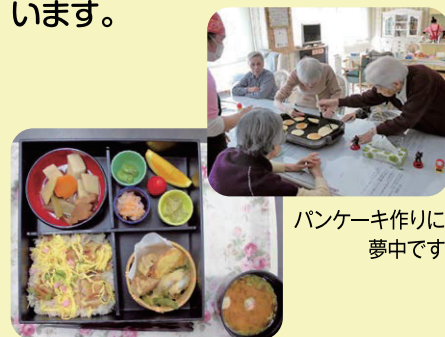
パンケーキ作りに 夢中です

旬の食材を生かして、味付け・栄 養のバランス・彩りに工夫を凝らし、 行事食や選択食を、又きざみ食 やソフト食もご用意しております。 料理クラブでも楽しんで頂いて います。