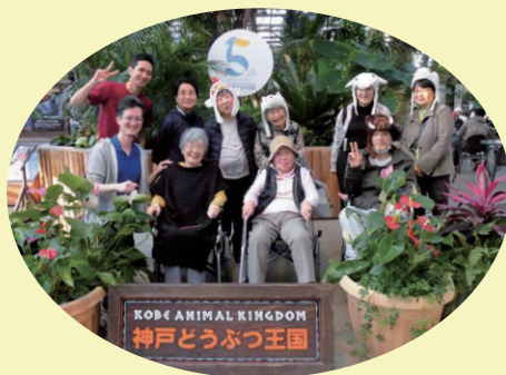
花や鳥とのふれあい

日々のお楽しみとして、ミュ ジック・歌体操やサークル活動に 参加して頂き、また外出してグル メ・お花見・観劇などで四季折々 の趣を楽しんで頂いています。